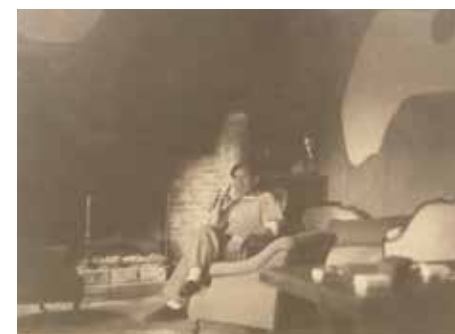
Anonyme, Nelson dans sa maison à Varengueville , Après 1938. Paris, Centre Georges Pompidou, Beaubourg, Bibliothèque Kandinsky, Fonds Nelson