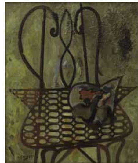
Georges Braque, La Chaise , 1947. Huile sur toile, 61 x 50 cm. Paris, Centre Pompidou, Musée national d'Art moderne / Centre de création industrielle, donation de Madame Georges Braque, 1965, AM 4306 P ; déposé au musée des Beaux-Arts de Caen depuis le 14 octobre 1998 © Paris, ADAGP 2019