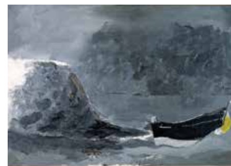
Georges Braque Barque sur la grève (marine noire) , 1960. Huile sur toile, 50 x 73 cm. Galerie Helly Nahmad, GB04088