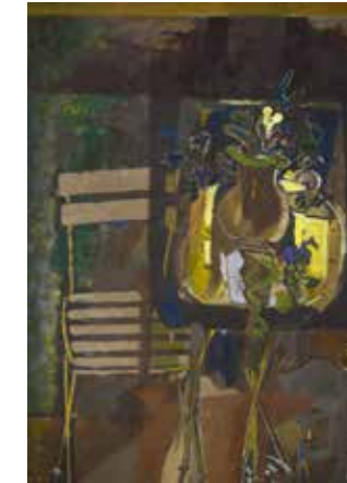
Georges Braque, La Chaise , 1947. Huile sur toile, 61 x 50 cm. Paris, Centre Pompidou, Musée national d'Art moderne / Centre de création industrielle, donation de Madame Georges Braque, 1965, AM 4306 P ; déposé au musée des Beaux-Arts de Caen depuis le 14 octobre 1998 © Paris, ADAGP 2019