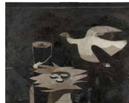
Georges Braque, L'oiseau et son nid , 1955. Huile et sable sur toile, 130,5 x 173,5 cm. Paris, Centre Pompidou, Musée national d'Art moderne / Centre de création industrielle, donation de Madame Georges Braque, 1965, AM 4307 P © Paris, ADAGP 2019