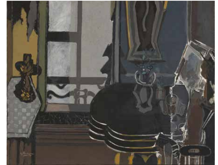
Georges Braque, Le Salon , 1944. Huile sur toile, 120,5 x 150,5 cm. Paris, Centre Pompidou, Musée national d'Art moderne / Centre de création industrielle, achat, 1946, AM 2605 P © Paris, ADAGP 2019