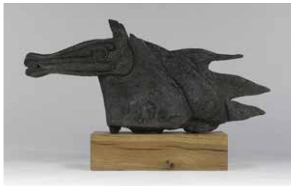
Georges Braque, Tête de cheval, 1941-1942. Bronze, 42 x 91 x 17,5 cm. Paris, Centre Pompidou, Musée national d'Art moderne / Centre de création industrielle, don de l'artiste, 1949, AM 882 S