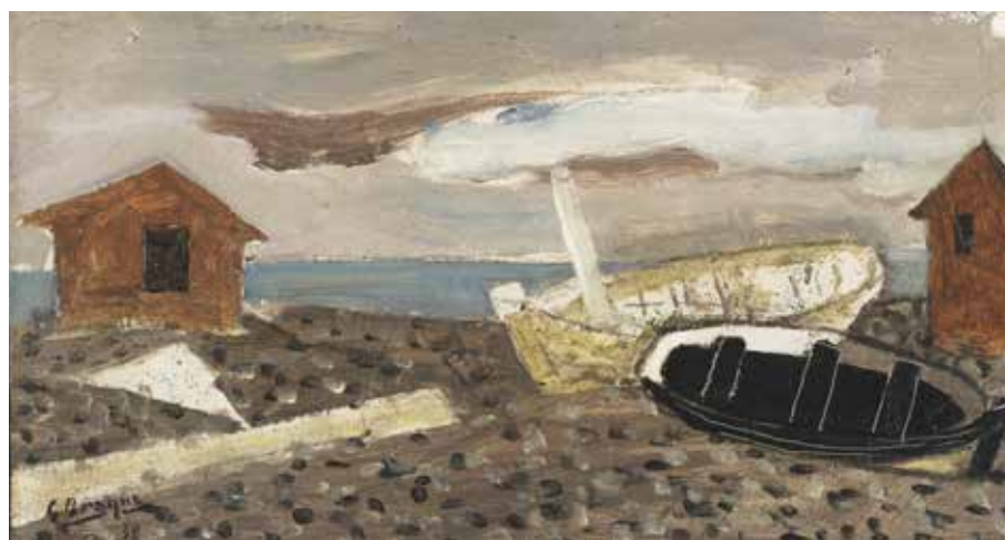
Georges Braque, Stormy Beach , 1938. Huile sur toile, 20,5 x 38,1 cm. USA, Philadelphia, Philadelphia Museum of Art © Paris, ADAGP 2019