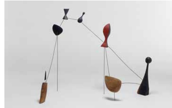
Alexander Calder, Constellation , 1943. Bois peint et fil de fer, 62 x 72,5 x 40 cm. Paris, Centre Pompidou, Musée national d'Art moderne / Centre de création industrielle, don de l'artiste, 1966, AM 1530 S © Paris, ADAGP 2019