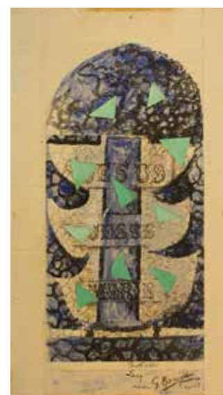
Georges Braque, L'Arbre de Jessé , vers 1955. Étude préparatoire au vitrail de l'église Saint-Valéry de Varengueville-sur-Mer. Gouache, plume, encre de Chine, collage sur feuille de papier quadrillé doublée sur carton, 54,5 x 34 cm. Rouen, musée des Beaux-Arts, inv. MBA.2018.3.1

Braque, acteur du renouveau de l'Art sacré de l'après-guerre, offre un deuxième tirage de la porte du tabernacle de l'église Notre-Dame de Toute-Grâce du Plateau d'Assy (Haute-Savoie) pour la nouvelle chapelle Saint-Dominique à l'entrée de Varengueville. Sollicité par l'abbé Jean Lecoq, curé du village, et soutenu par son épouse et le père Couturier, Braque réalise les vitraux du chœur Dominique avançant vers la sainteté (1951-1954) et de la nef avec le peintre verrier Paul Bony. Enthousiasmé par cette expérience, il offre la maquette du vitrail L'Arbre de Jessé , 1956, pour l'église Saint-Valéry . Il est réalisé en 1961 sur ordre d'André Malraux alors Ministre d'Etat des affaires culturelles.