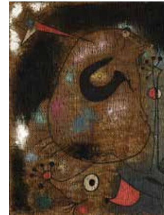
Joan Miró, Tête de femme , Varengeville-sur-Mer, novembre 1939. Huile sur toile de jute, 61 x 46,5 cm. Galerie Helly Nahmad, JM3656 © Paris, ADAGP 2019