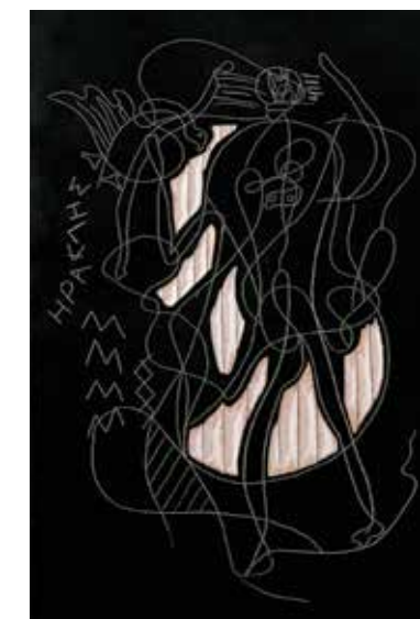
Georges Braque, La Pianiste , 1937. Huile et sable sur toile, 145 x 102,5 cm. Galerie Helly Nahmad, GB55139