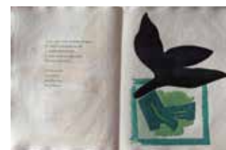
Guillaume Apollinaire, Georges Braque, Si je mourais là-bas, 1915/1962. Bois gravé en couleur. Paris, Louis Broder, 1962. Saint-Paul-de-Vence, Fondation Marguerite et Aimé Maeght