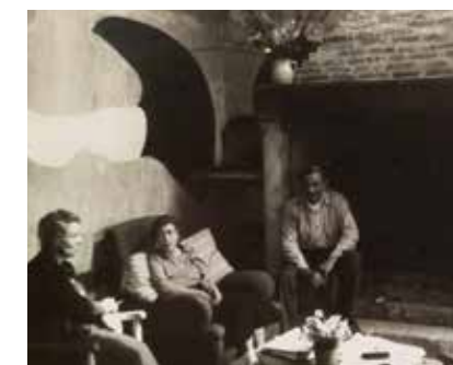
Anonyme, Salon de Nelson orné des peintures murales de Miró , épreuve gélatino-argentique, collection particulière.