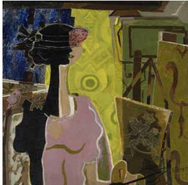
Georges Braque, Femme au chevalet , 1936. Huile sur toile, 92,1 x 92,2 cm. Lyon, musée des Beaux-Arts, legs Jacqueline Delubac, inv. 1997-25 © Paris, ADAGP 2019