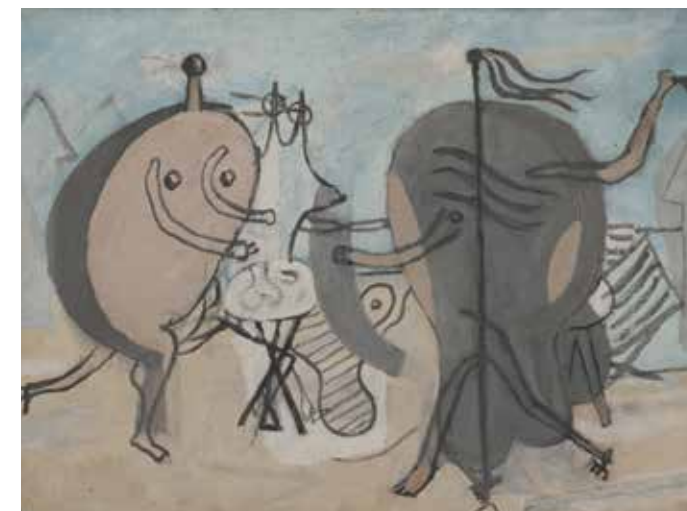
Georges Braque, La plage , 1932. Huile sur toile, 30,5 x 41 cm. Lausanne, collection A.-M. Laurens © Paris, ADAGP 2019