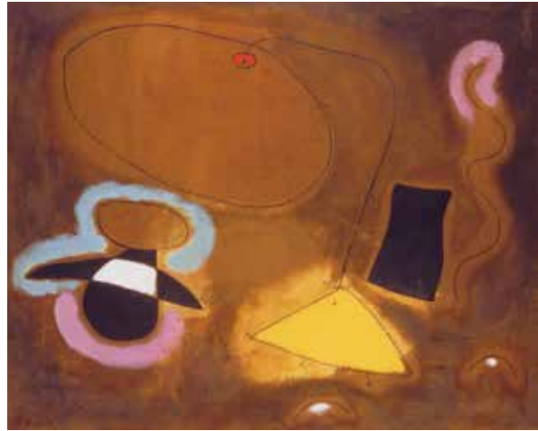
Joan Miró, Le Vol d'un oiseau sur la plaine II , juillet 1939. Huile sur toile, 81 x 100 cm. Galerie Helly Nahmad, JM3207 © Paris, ADAGP 2019