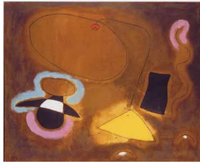
Joan Miró, Le Vol d'un oiseau sur la plaine II , juillet 1939. Huile sur toile, 81 x 100 cm. Galerie Helly Nahmad, JM3207 © Paris, ADAGP 2019