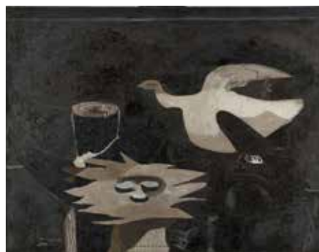
Georges Braque, L'oiseau et son nid , 1955. Huile et sable sur toile, 130,5 x 173,5 cm. Paris, Centre Pompidou, Musée national d'Art moderne / Centre de création industrielle, donation de Madame Georges Braque, 1965, AM 4307 P © Paris, ADAGP 2019

Nelson est en 1949 l'architecte d'un nouvel atelier en préfabriqué sur la propriété de Georges Braque. Enchâssées dans des structures métalliques, les hautes baies qui montent sur le toit apportent à l'espace de création du peintre un éclairage et une ouverture sur le ciel propices à un renouvellement qui ne tarde pas à venir. De 1949 à 1956, Braque s'engage dans la série introspective des Ateliers I à IX . À travers ces huit grandes toiles – l'Atelier VII n'existant pas – au désordre composé et suggestif, surgit l'oiseau qui s'impose comme le motif majeur de ses quinze dernières années. En plein vol dans les premiers tableaux, l'oiseau de l'Atelier VI se dresse au sommet d'un chevalet. Point central, il attire le regard et organise la composition. Il est le « choc du chant », répond Braque au poète André Verdet qui l'interroge. «