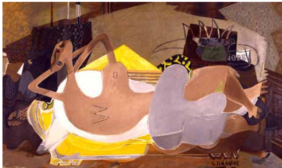
Georges Braque, Nu couché , 1935, achevé dans les années 1950. Huile sur toile, 114 x 195 cm. Galerie Helly Nahmad, GB2695 © Paris, ADAGP 2019