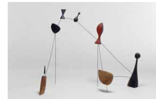
Alexander Calder, Constellation , 1943. Bois peint et fil de fer, 62 x 72,5 x 40 cm. Paris, Centre Pompidou, Musée national d'Art moderne / Centre de création industrielle, don de l'artiste, 1966, AM 1530 S

Quant à Braque, replié en Normandie pendant les premiers mois de la guerre, il exécute des natures mortes sombres et sévères, des vanités, images du malheur de la guerre : poissons noirs christiques ( Les Poissons noirs , 1942), crânes et crucifix à la matière épaisse ( Vanitas , 1939), renvoient l'image d'un artiste exclusivement tourné vers l'intérieur et replié sur son environnement immédiat.