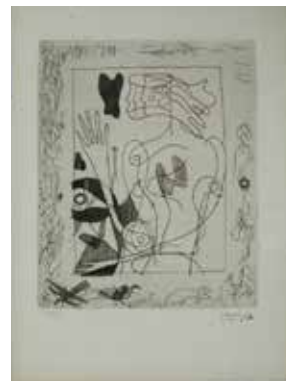
Georges Braque, Planches de la Théogonie d'Hésiode – suite Vollard, 1932. Eau-forte sur papier, 53 x 38 cm. Belfort, Musée d'art moderne – Donation Maurice Jardot, inv DHK.002.1.1-16.