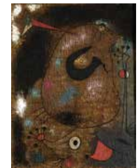
Joan Miró, Tête de femme , Varengeville-sur-Mer, novembre 1939. Huile sur toile de jute, 61 x 46,5 cm. Galerie Helly Nahmad, JM3656